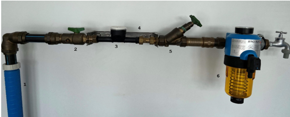
Skizze (Foto mit Beschriftung/Erläuterung) Wasserzähleranlage

Wasserbedarfsberechnung und Zählergröße bei Mehrfamilienhäusern/Gewerbebetrieben